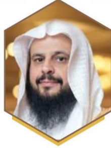
حسن بن محمد بن عبد الله الحسن نائب الرئيس