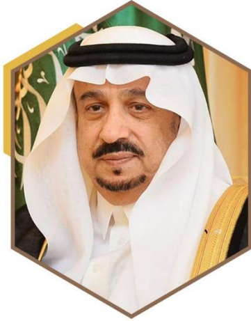
صاحب السمو الملكي